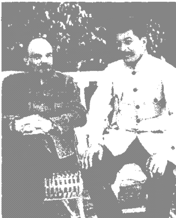
Учитель и Ученик