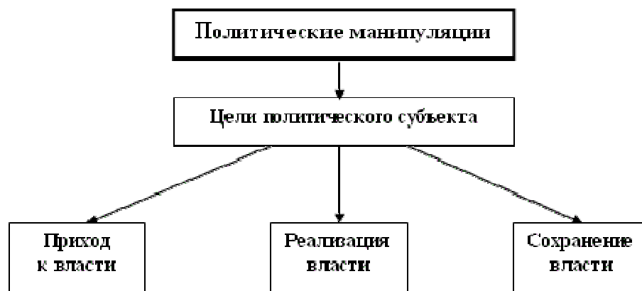
Схема 2. Основные цели политических манипуляций

Политические манипуляции представляют собой средство достижения определенных целей неким политическим субъектом. Основным «призом» в политической борьбе является власть. Цель деятельности любой политической партии, группы и отдельных лидеров — приход к власти. Придя к власти, субъект политического процесса стремится эту власть реализовать и сохранить (удержать), поскольку всегда есть много желающих ее отнять. Таким образом, вырисовываются три основные цели, которые преследуют политические партии и их лидеры: приход к власти, ее реализация и ее сохранение (удержание). Соответственно, для достижения каждой из вышеназванных целей существуют свои методы и средства, в том числе и манипулятивные. Политические манипуляции используются для достижения этих целей.