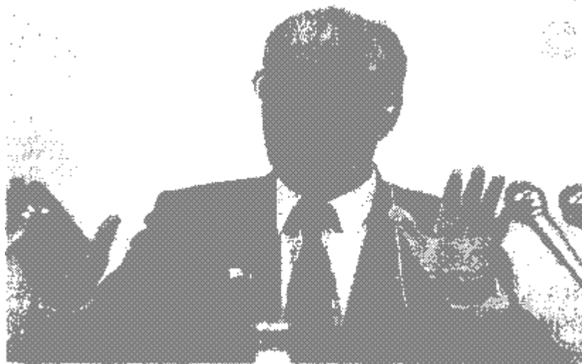
«Пассы» М. Горбачева

Конечно, «можно повысить свой кредит доверия, выработав привычку в процессе общения с людьми держать ладони открытыми» 72 . Лучше всех это умел делать М. Горбачев.